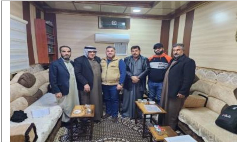
Public consultations at KHOR SIBAT village