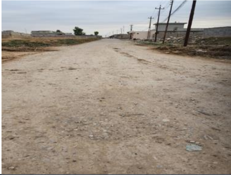
Roads in TOPZAWA