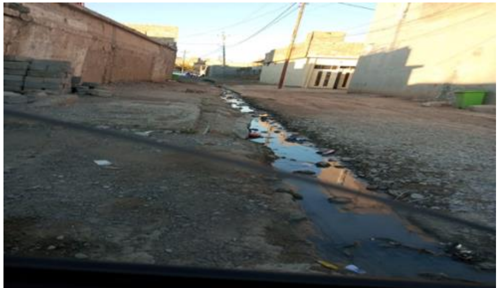
Roads in KHOR SIBAT

The area adjacent to these subprojects' sites are characterized as rural residential and semi desartic to agricultural in some area. There are no protected areas or endangered species (there is no critical or high biodiversity values that might be affected) in the vicinity of the sites. There are no close sensitive receptors located to the subprojects site. The subprojects will improve the transportation infrastructure in these villages by providing asphalt surface to facilitate transport for local communities and road users. Moreover, the road will help the students to go to their schools easily. It important to mention that these roads are within the villages as a network, therefore the other roads can be used as alternative roads.