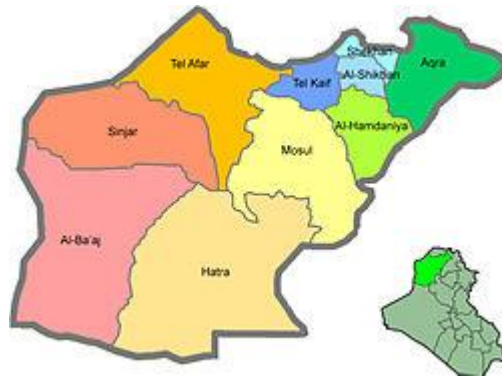
Figure 1: Project Location

The area adjacent to these subprojects' sites are characterized as rural residential and semi desartic to agricultural in some area. There are no protected areas or endangered species (there is no critical or high biodiversity values that might be affected) in the vicinity of the sites. There are no close sensitive receptors located to the subprojects site. The subprojects will improve the transportation infrastructure in these villages by providing asphalt surface to facilitate transport for local communities and road users. Moreover, the road will help the students to go to their schools easily. It important to mention that these roads are within the villages as a network, therefore the other roads can be used as alternative roads.