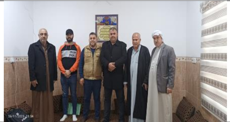
Public consultations at TOPZAWA village