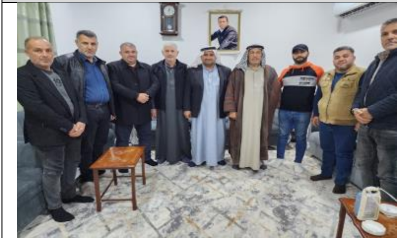
Public consultations at SHEREKHAN AL-SUFLA village