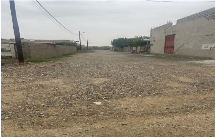
Roads in SHEREKHAN AL-SUFLA,