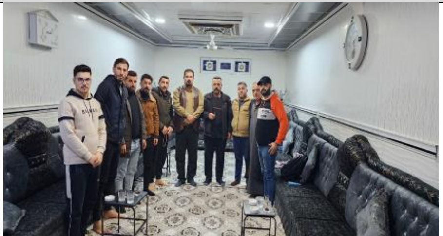
Public consultations at OMAR QABJI village