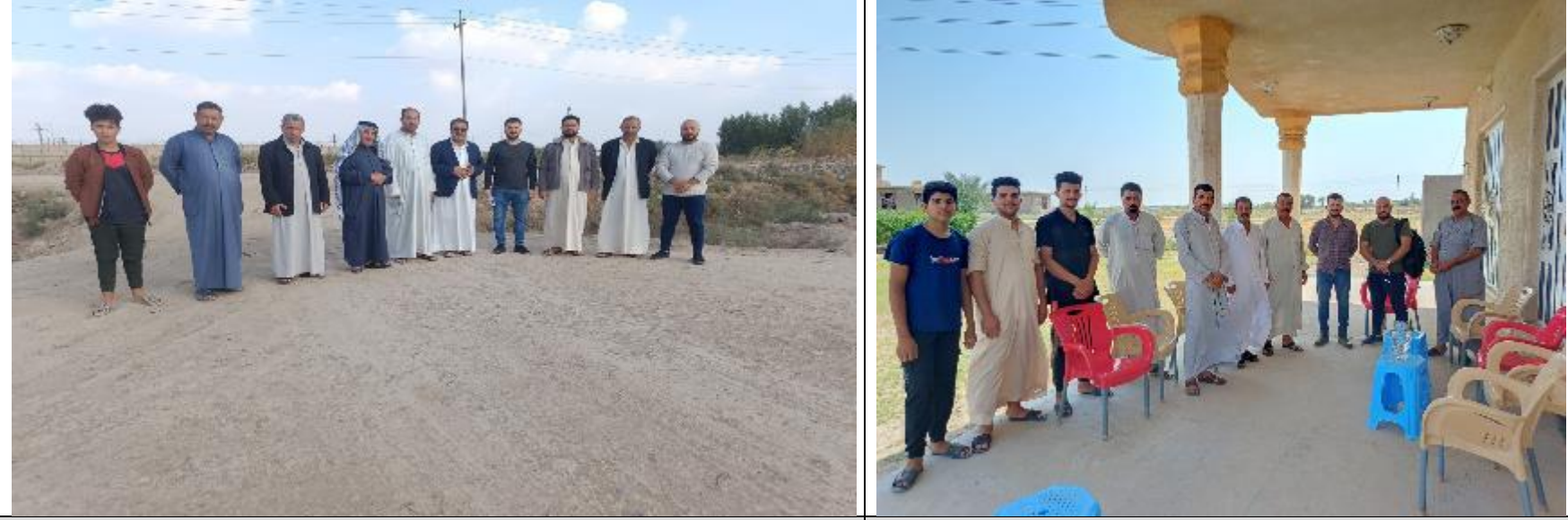
Public Consultations at AL-INTISAR Village