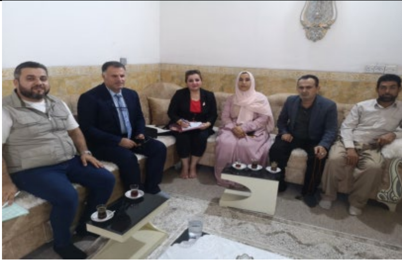
Public Consultations at BEN BIRZI KAWORA Village