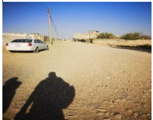
Roads in KURDA JAL