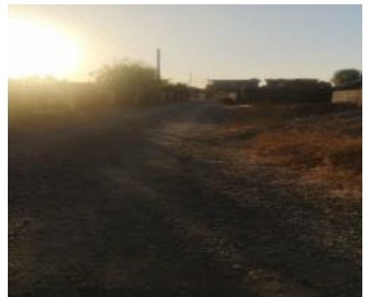
Roads in KAYNJI KORA