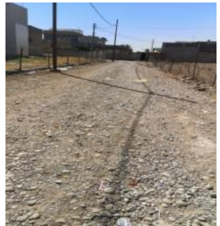
Roads in SHEIKHA SHELL