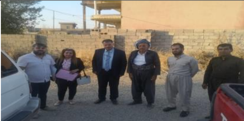
Public Consultations at KAYNJI KORA Village