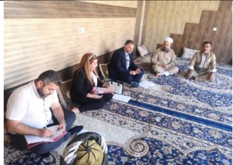
Public Consultations at SHEIKHA SHELL Village