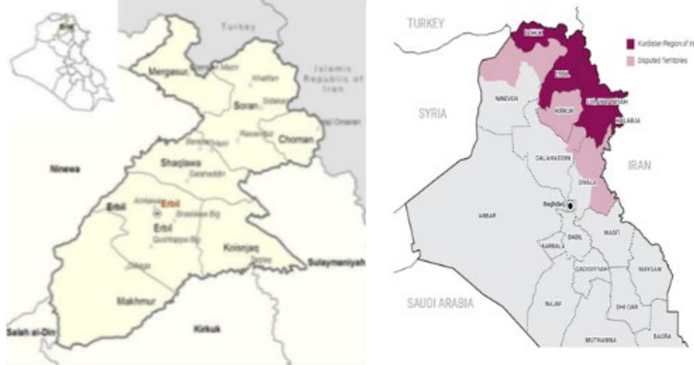
Figure 1: Project Location

The area adjacent to these subprojects' sites are characterized as rural residential and semi desertic to agricultural in some area. There are no protected areas or endangered species (there is no critical or high biodiversity values that might be affected) in the vicinity of the sites. There are no close sensitive receptors located to the subprojects site. The subprojects will improve the transportation infrastructure in these villages by providing asphalt surface to facilitate transport for local communities and road users. Moreover, the road will help the students to go to their schools easily. It important to mention that these roads are within the villages as a network, therefore the other roads can be used as alternative roads.