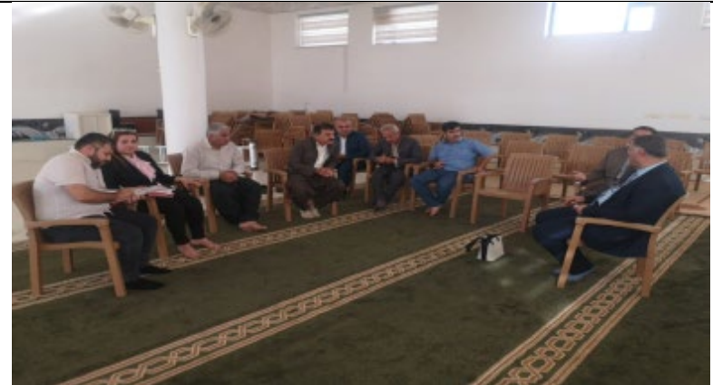
Public Consultations at KURDA JAL Village