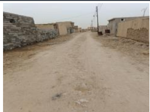
Roads in Tel qosb alqudim