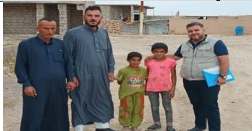
Public Consultations at Sebaya harouche Village