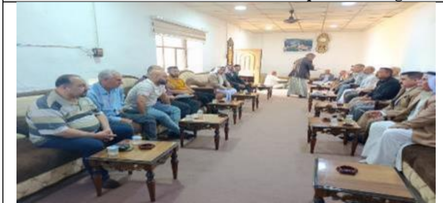
Public Consultations at Tel Qosb Alqudim Village