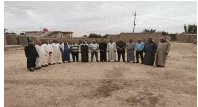
Public consultations at Al-Khnissi village