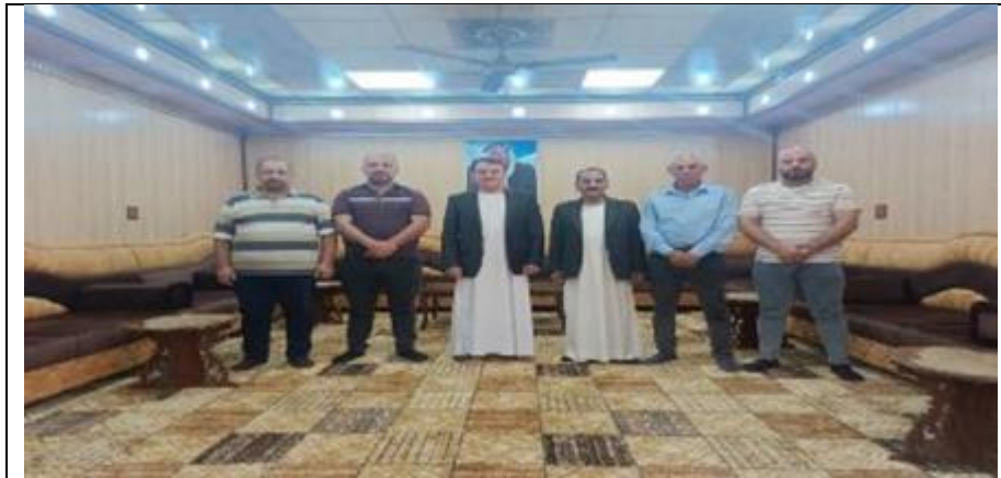
Public consultations at Tel benat alqudim village