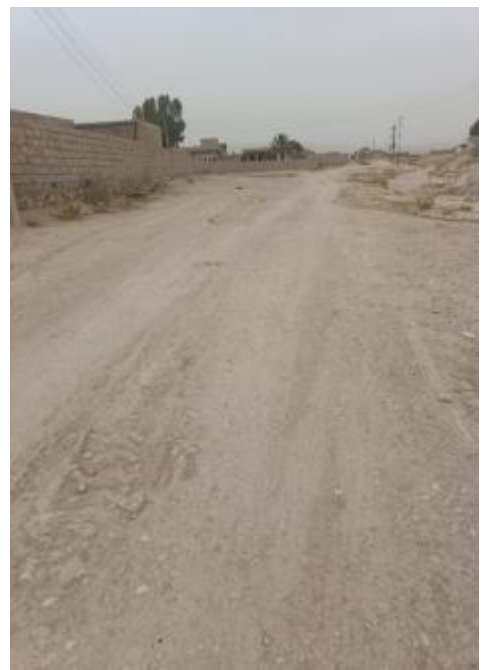
Roads in Tel benat alqudim