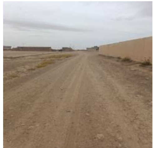
Roads in Al-Khnissi