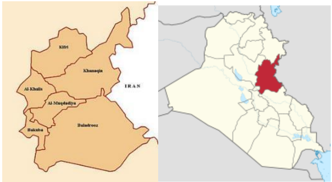
Figure 1: Project Location

The area adjacent to the subprojects site are characterized as rural residential and semi deserts in some areas.