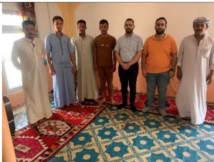
Public Consultations at AL-HAMAYEL 1 Village