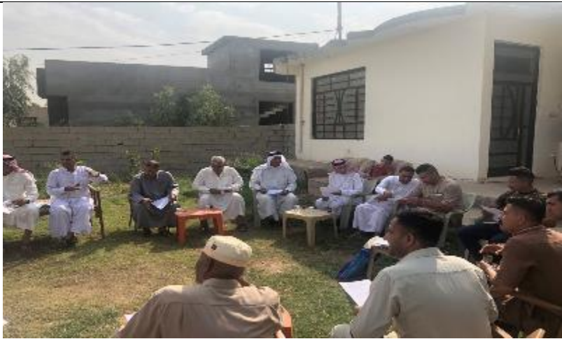
Public Consultations at AL-HASHEMIA ALSAGHIRA , Village