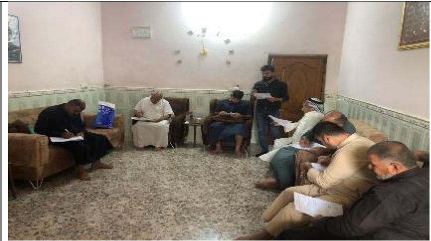
Public Consultations at AL-BU KHALEEL Village