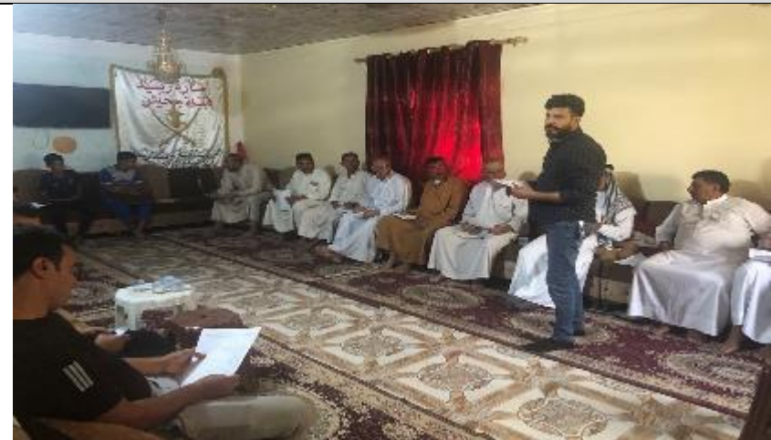
Public Consultations at ABO KHAMEES Village