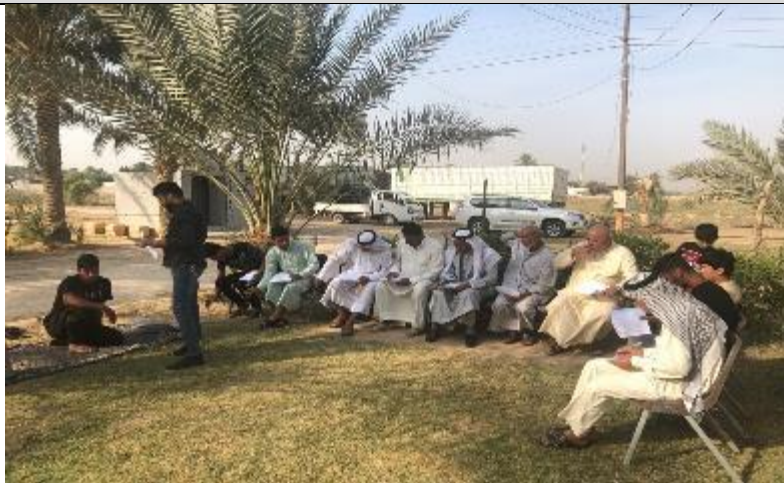
Public Consultations at AL-MAHBOBIA , Village