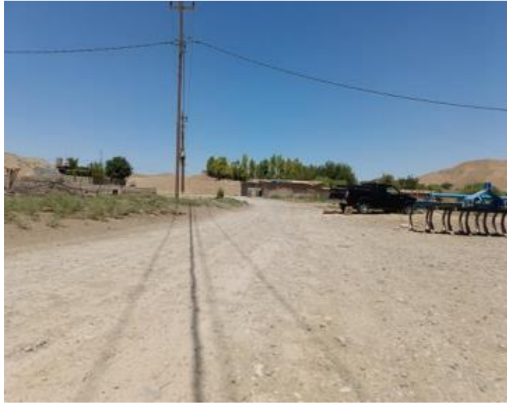
Roads in BEREKAN