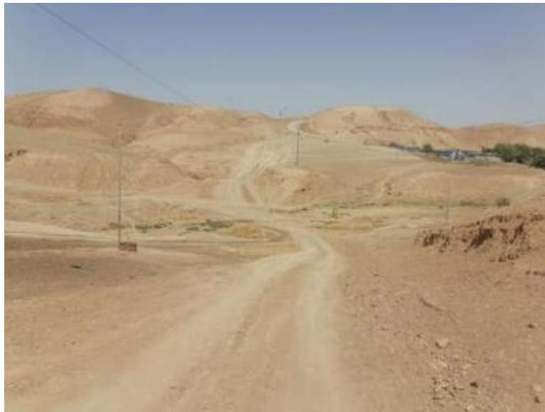
Roads in YEKHTKHAN