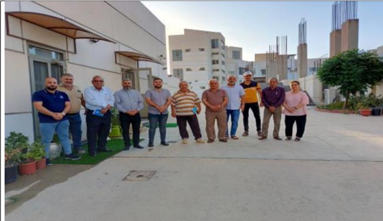
Public Consultations at SIKANYAN Village