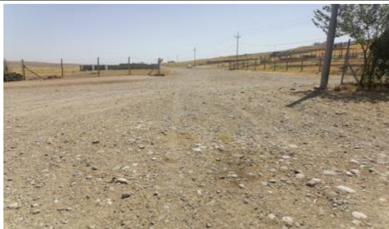
Roads in BASHBLAG

The area adjacent to these subprojects' sites are characterized as rural residential and semi desertic to agricultural in some area. There are no protected areas or endangered species (there is no critical or high biodiversity values that might be affected) in the vicinity of the sites. There are no close sensitive receptors located to the subprojects site. The subprojects will improve the transportation infrastructure in these villages by providing asphalt surface to facilitate transport for local communities and road users. Moreover, the road will help the students to go to their schools easily. It important to mention that these roads are within the villages as a network, therefore the other roads can be used as alternative roads.