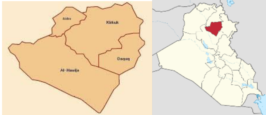
Figure 1: Project Location

The area adjacent to these subprojects' sites are characterized as rural residential and semi desertic to agricultural in some area. There are no protected areas or endangered species (there is no critical or high biodiversity values that might be affected) in the vicinity of the sites. There are no close sensitive receptors located to the subprojects site. The subprojects will improve the transportation infrastructure in these villages by providing asphalt surface to facilitate transport for local communities and road users. Moreover, the road will help the students to go to their schools easily. It important to mention that these roads are within the villages as a network, therefore the other roads can be used as alternative roads.