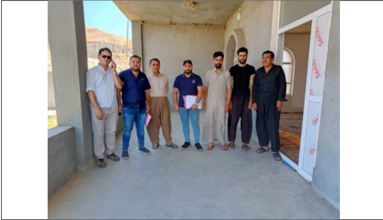
Public Consultations at YEKHTKHAN Village