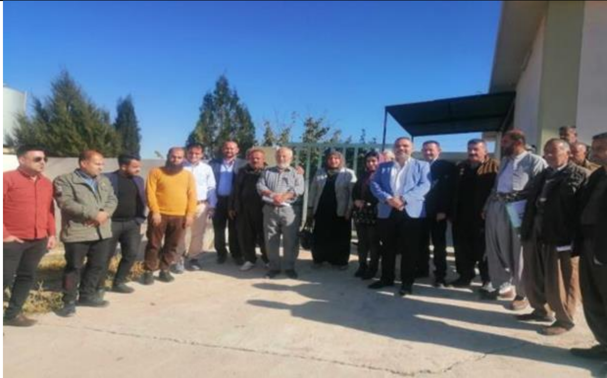
Public Consultations at BASHBLAG Village