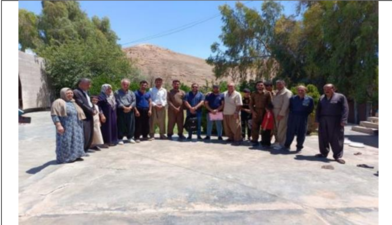
Public Consultations at BEREGAN Village