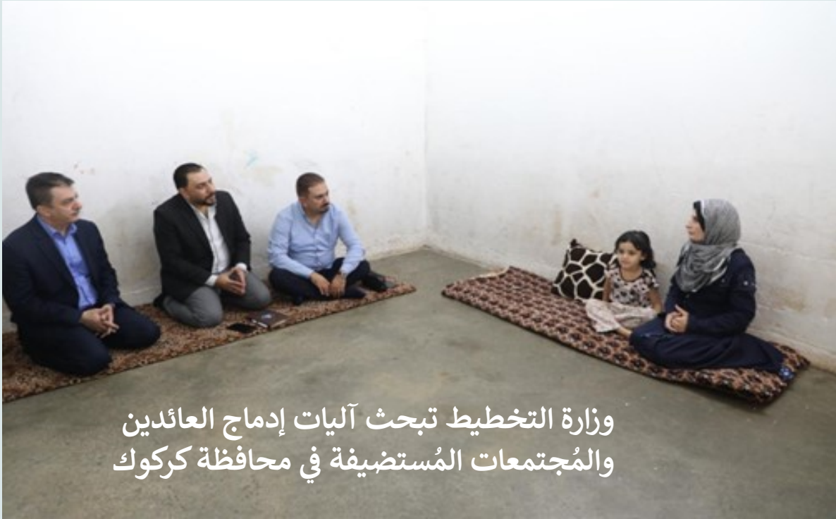
وزارة التخطيط تبحث آليات إدماج العائدين والمجتمعات المُستضيفة في محافظة كركوك